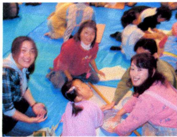
そば粉とうどん粉を混ぜます