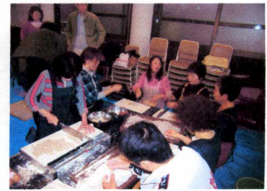
のぼした生地を麺きりします！