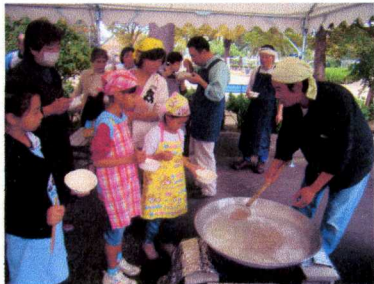
ほーら♪おそばがゆで上がったよ♡