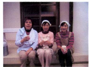
そば湯を飲んでより美人になりました★