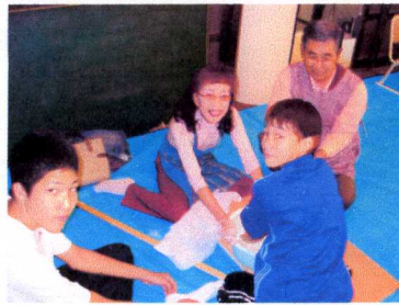
つなぎば山芋と玉子です