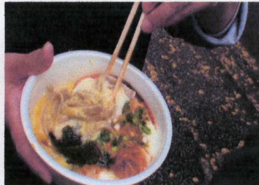
豪華! 釜揚げとろろなめこそば あ〜♪おいしいね!!