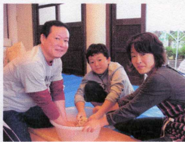
そば粉をひたすらこねます