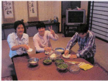
つなぎの山芋をおろします