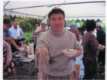
こんなん出ましたー☆