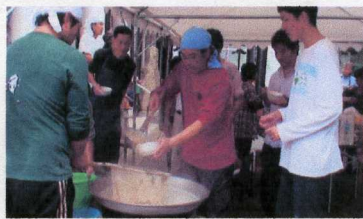
大鍋で豪快にゆで上げます♡