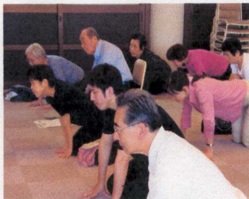
ライオンになりきる♡