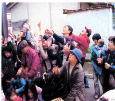
福を分けてもらう参加者