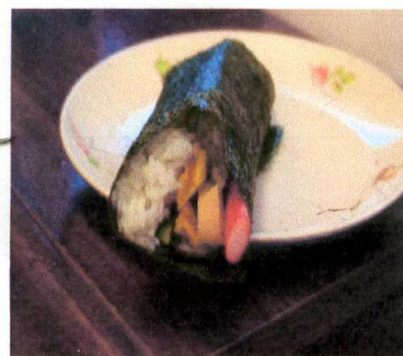
見事なオリジナル太巻き