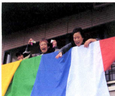
丑年の方たちによる福投げ