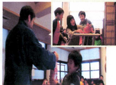
黒ひげゲームで優勝した少年