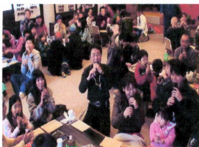
「ワッハッハ」の笑いで丸かぶり